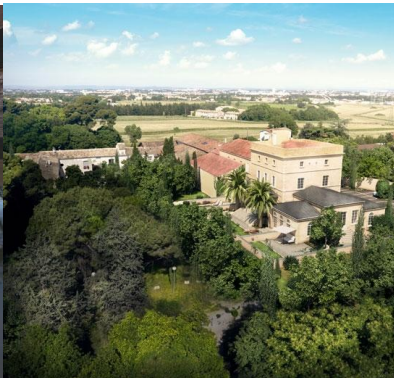
le mas de Soriech