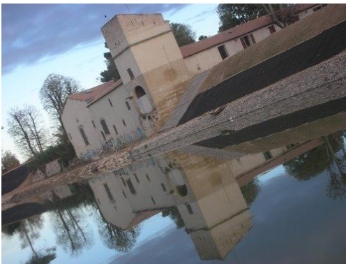
le mas d'Encivade