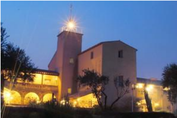
le mas de Saporta