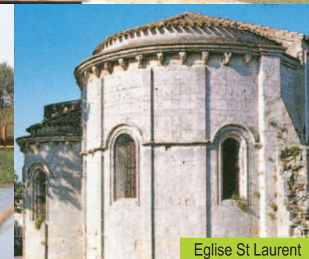
Eglise St Laurent