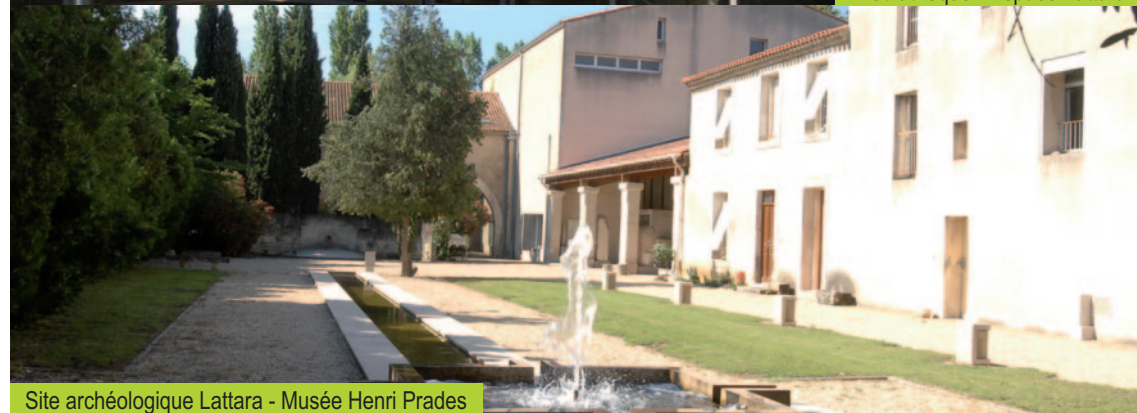
Site archéologique Lattara - Musée Henri Prades