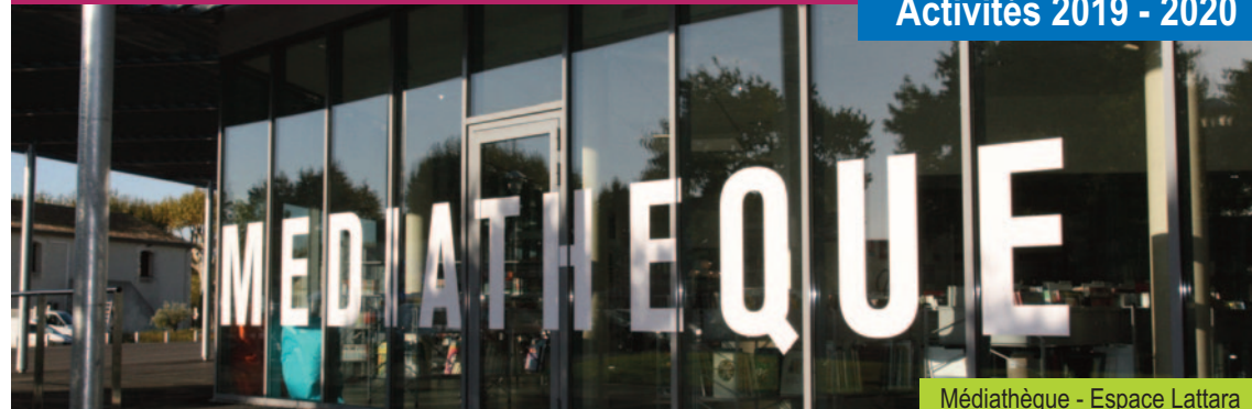
Médiathèque - Espace Lattara