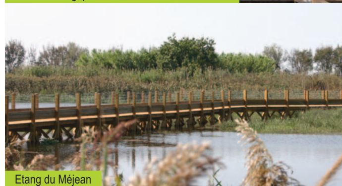
Etang du Méjean