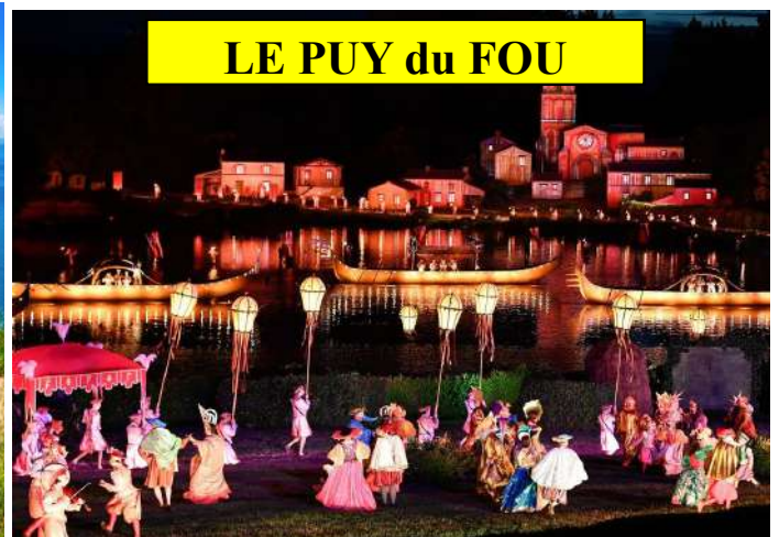
LE PUY du FOU