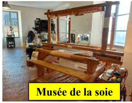
Musée de la soie